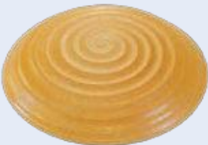
plocher harmonizer Art.-Nr. ha 5111

Mit Hilfe von plocher harmonizer und plocher e-smog-winkel können wir Ihnen den gesamten Strahlungsbereich harmonisieren!