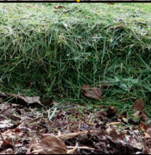
29.03.2014 darauf 20 cm Rasenschnitt