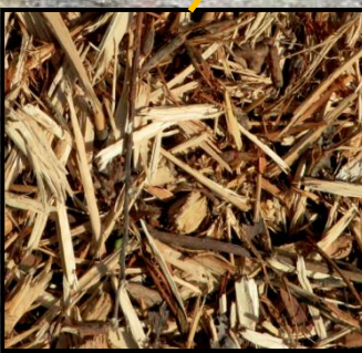
29.03.2014 30 cm Holz-Häcksel aufgeschüttet