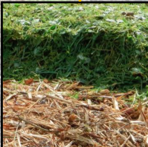
29.03.2014 20 cm moosiger Rasenschnitt, auf ausschliesslich Holz-Häcksel