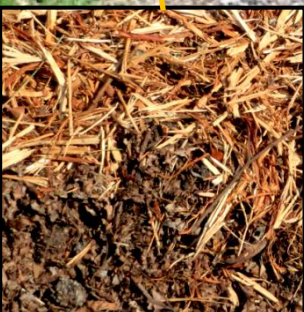
29.03.2014 Häcksel auf Blättern